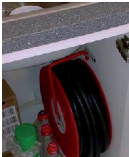
Bildet viser en husbrannslange montert i kjøkkenbenken.

Vann er verdens beste slökkemiddel og er særlig fint til å slokke branner i møbler og treverk. Det anbefales å anskaffe husbrannslange som ikke trenger å få rullet ut hele slangen før du skrur på vannet. Slangen skal være fastmontert til en kran og skal rekke til alle rom i huset. Hageslange er ikke godkjent som husbrannslange. Husbrannslangen kontrolleres ved å undersøke om slangen tåler vanntrykk uten å lekke og ved å se til at koblingskranen fungerer etter sin hensikt.